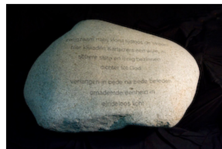
Pien Storm van Leeuwen

verlangen in bede na bede beleden omademde eenheid in eindeloes licht